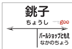
図1：銚子駅看板デザイン

2016年12月1日から1年間、銚子駅舎および銚子駅ホームに、銚子電鉄と「goo」がコラボレーションした看板を新たに設置します。（図1参照）